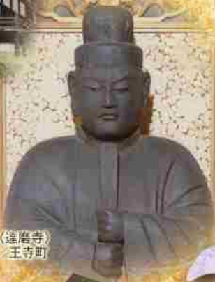
木造 聖徳太子坐像 (蓮磨寺) 鎌倉時代 重要文化財 王寺町