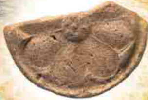
素弁蓮華文軒丸瓦 (平隆寺) 飛鳥時代 帝塚山大学蔵 / 三郷町